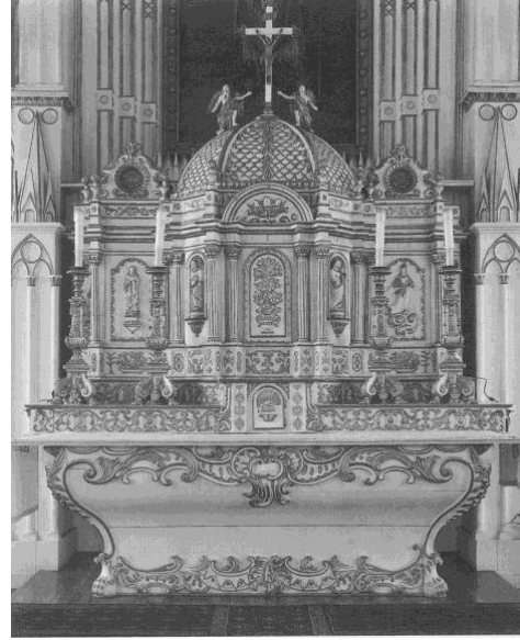
III. 3 – Maître-autel et tabernacle de l'église de Saint-Sulpice.