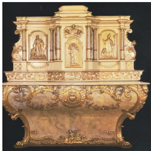
III. 4 – Autel latéral de Philippe Liébert, Maison des sœurs grises de Montréal.