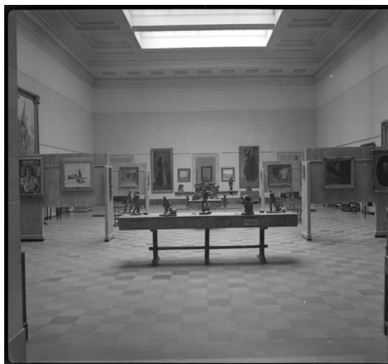
Ill. 11 – Neuville Bazin, Vue générale de la salle des peintures au Musée provincial de Québec en 1943.