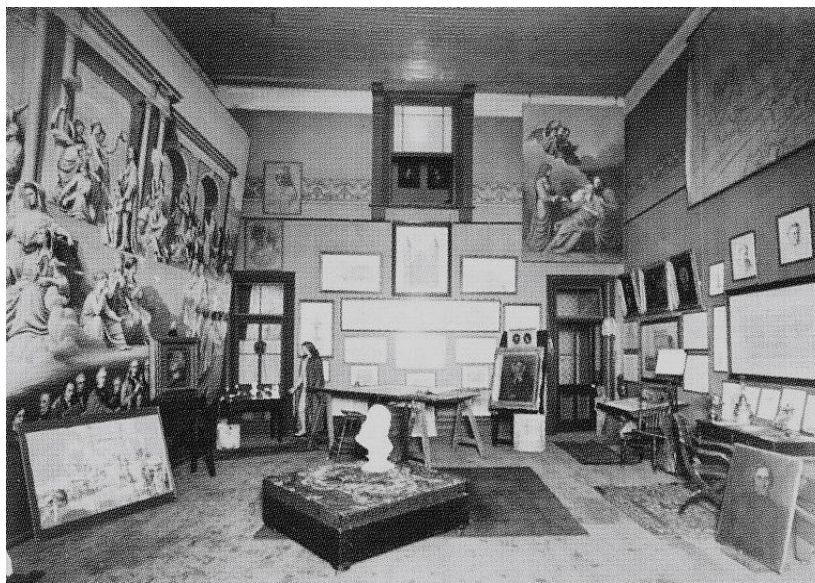
III. 9 – Studio Notman, Étape préparatoire à l'exposition posthume organisée par Augustine Bourassa des œuvres de son père dans son atelier de la rue Sainte-Julie, à Montréal, vue vers l'est, été (?) 1917, épreuve à la gélatine argentique, 20,5 x 25,3 cm.

et âme. La Mort de saint Joseph est donc bien en plein accord avec la philosophie esthétique de Bourassa pour qui la forme n'est qu'un véhicule à l'Idée, au même titre que le corps est une enveloppe de l'âme 14 . Ainsi, la photographie de l'atelier nous permet de reconnaître, dans ce que l'on prend trop rapidement pour des manquements dans le tableau, le sens profond de l'art et de l'esthétique de Bourassa, expliquant qu'il ne se soit jamais départi cette œuvre.