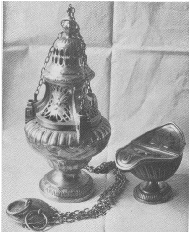
III. 5 – François Sasseville, Encensoir et navette .

sélection à titre d'œuvres d'art; le document photographique montrant que leurs qualités esthétiques fonctionnent de manière autonome, hors de leur contexte de réalisation 7 .