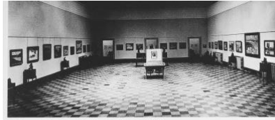
Fig. 14. Réproduction Clarence Gagnon. Musée de la province de Québec, juin/juillet 1942.

des environs de Baie-Saint-Paul. Gagnon en appelle de sa propre expérience du terrain et d'une section de pays qui se présente au fil de sa démarche. Cette vision personnelle s'inscrit par ailleurs dans une plus vaste structure d'horizon, comme au le verra en déclinant habilement le caractère « national » de la période. Ce savoir donne un aperçu de la nouvelle dynamique de recherche et d'exploration identitaires qui se développe au Canada durant le premier tiers du 20 e siècle. En abordant ensuite la carrière artistique de Clarence Gagnon, on verra comment il contribue à cette phase de la modernité culturelle qui visait, essentiellement, un plus grand enracinement dans le milieu indigène.