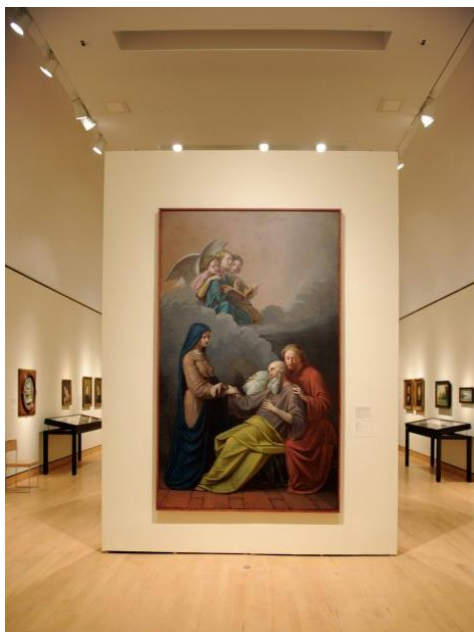
Ill. 8 – Napoléon Bourassa, La Mort de saint Joseph , huile sur toile, 292 x 183 cm, Montréal, Musée de l'Oratoire Saint-Joseph du Mont-Royal, présentée dans l'exposition Napoléon Bourassa. La quête de l'idéal .