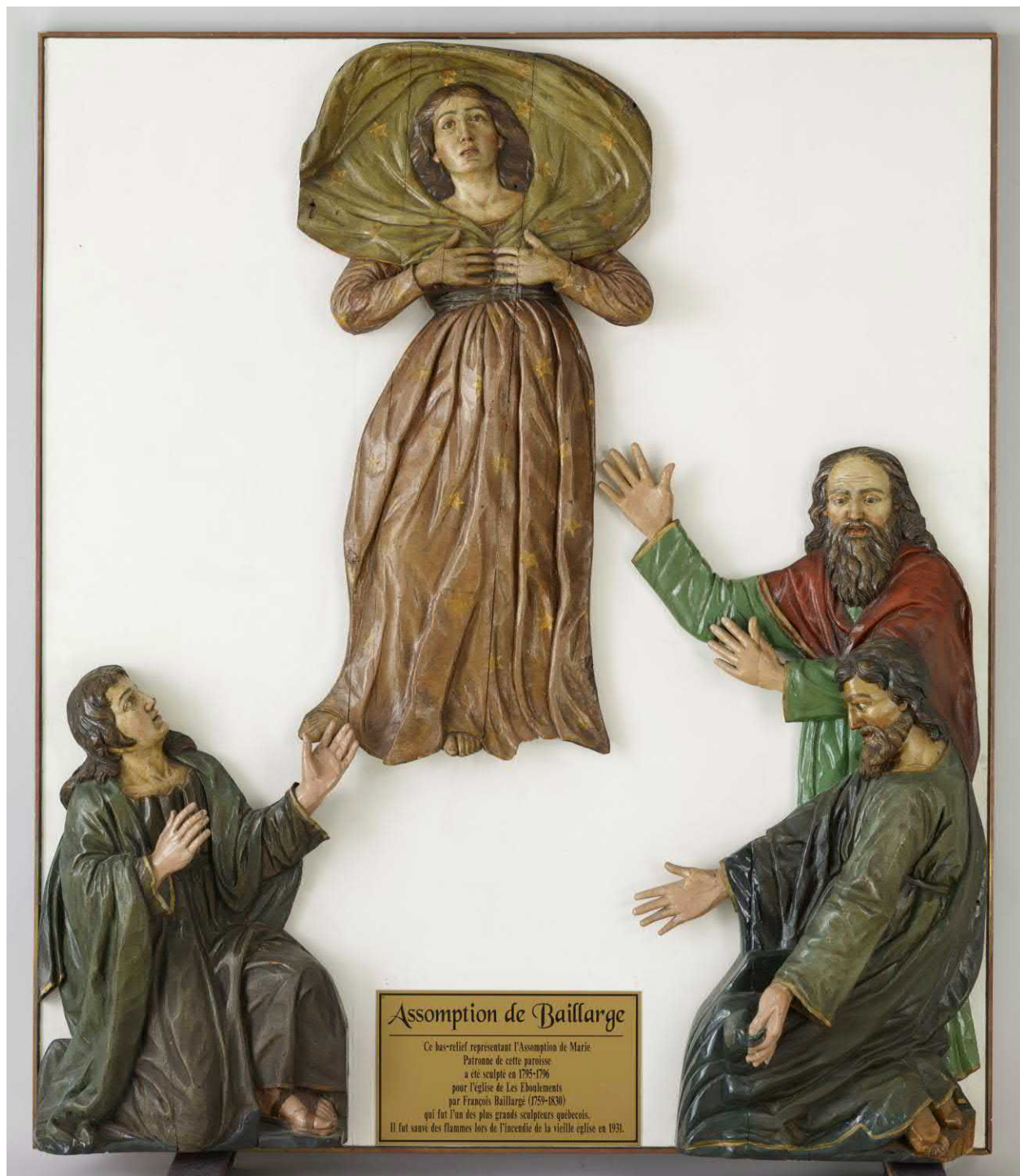
Figure 8 : L'Assomption de la Vierge , haut-relief de François Baillargé, 1797. Bois sculpté, peint polychrome et doré. Avant traitement. Fabrique de L'Assomption-de-la-Sainte-Vierge, Les Éboulements (Québec).