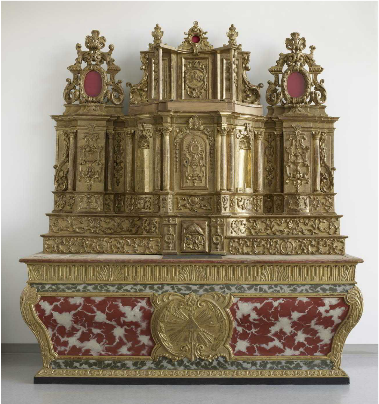
Figure 2 : Ancien maître-autel de l'église de Sainte-Anne-de-la-Pérade, après traitement. Restauré au CCQ de 2003 à 2007.