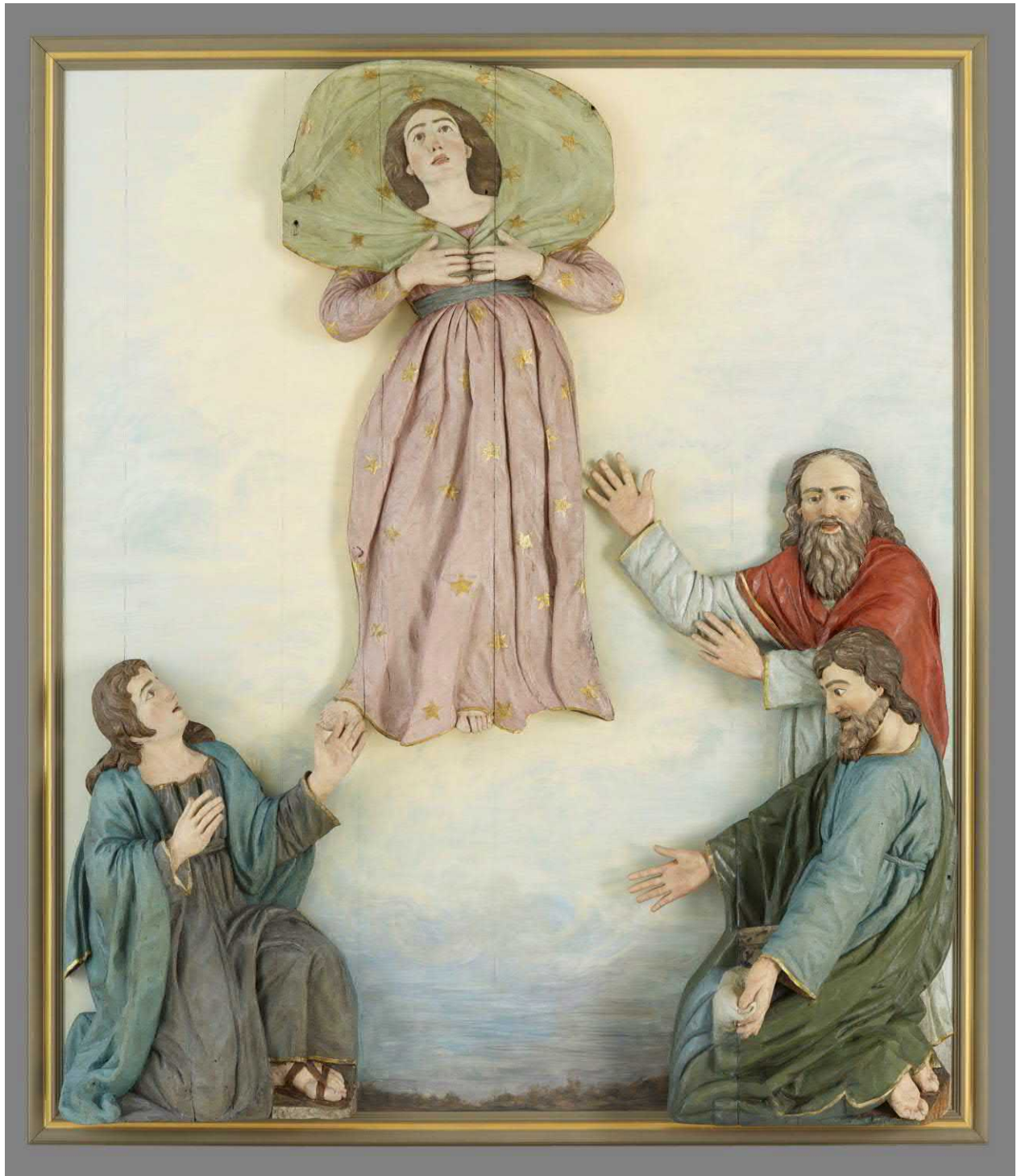
Figure 9 : L'Assomption de la Vierge , haut-relief de François Baillairgé, 1797. Bois sculpté, peint polychrome et doré. Après traitement. Restauré au CCQ de 2017 à 2018.