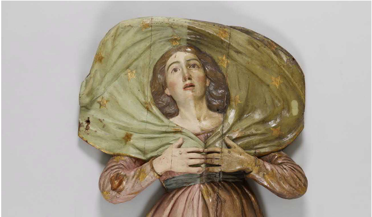
Figure 10 : Détail de la figure de la Vierge pendant le traitement. L'assombrissement dramatique des vernis ajoutés au fil du temps avait complètement faussé la perception des couleurs.