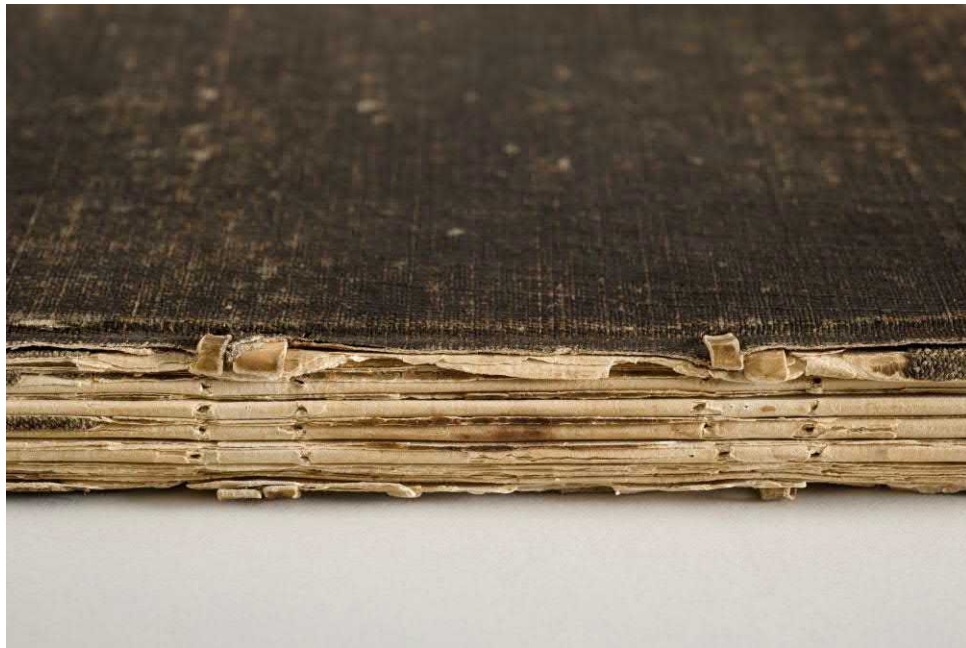
Figure 5 : Détail de la reliure du journal complètement disloquée. Avant traitement. BAnQ : cote P398, P1.