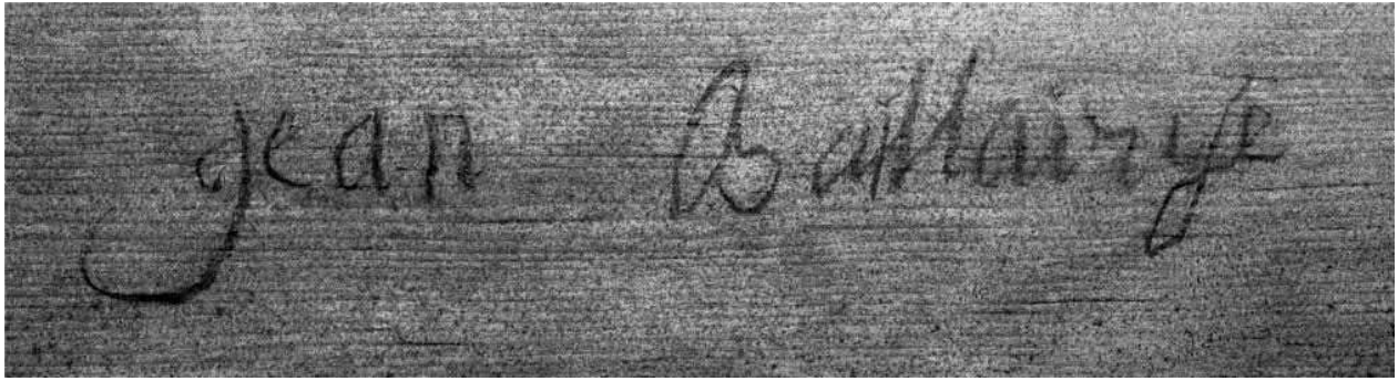
Figure 3 : Signature de Jean Baillairgé découverte au revers de la façade lors du traitement.